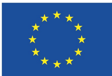
Euroopa Liit Euroopa Regionaalarengu Fond